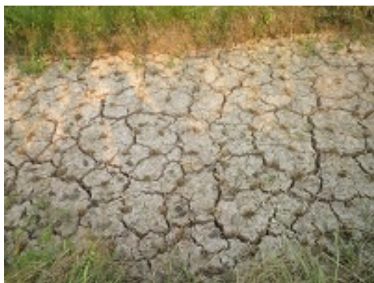
写真9 40 を超えた天気の中で水田（未使用）に大きな裂け目が出ている