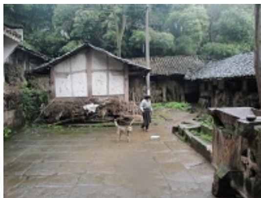
写真2 重慶・五村8隊(陳氏)四合院 かつて50-80人が住んでいたが、現在女性範氏一人しか残っていない。範氏は獰猛な犬を飼い(鉄の首輪をつけて、犬が全院落まで走れる)、院落を守っている。