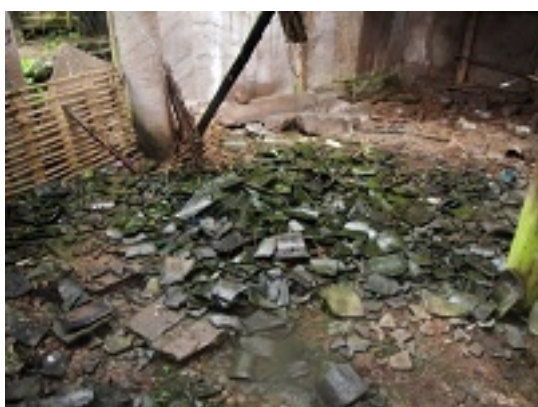
写真3 重慶・五村8隊(陳氏)四合院西廂房の煉瓦が落ち、荒廃の光景が伺える。