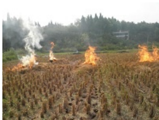
写真 17 アワ殻を焼く (稲穂を刈ってから2,3時間で干し草になる 乾燥したワラに火つけて焼けば, 水田の肥料になる) 写真 18