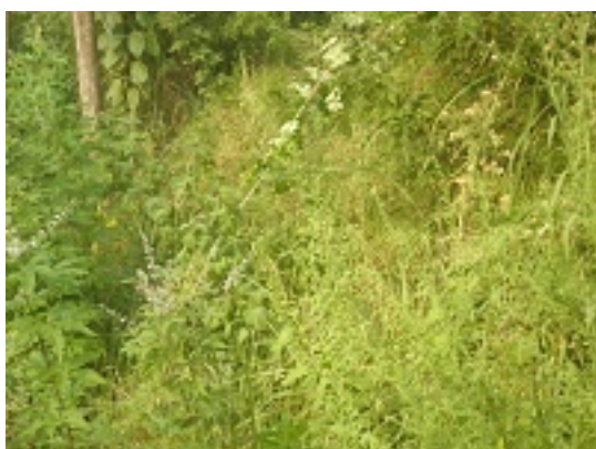
写真 13 野草・茨の蔓が茂る 元の道が見えず茨の道と化す