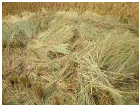
写真 15 アワ殻は燃料として使う必要がなくなった