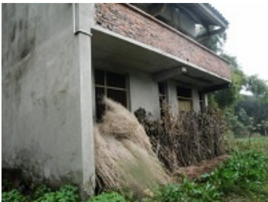
写真5 重慶・5村8隊出稼ぎで10年以上経った嚴氏族の一戸建て（無人居住）