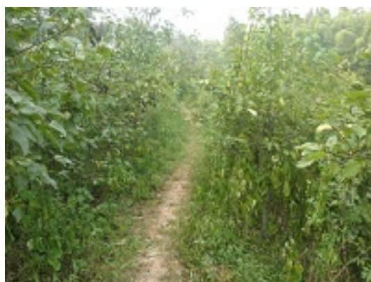
写真 14 たまに道を見つける