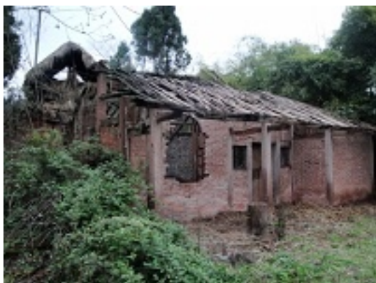
写真1 重慶・石馬村2隊拳家離村した趙氏家族の部屋。 (以下の写真は、数回現地調査によって撮影したものである。)