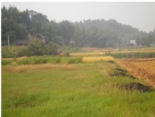
写真 11 荒廃している水田